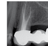
Feinste Wurzelkanäle – mit mikroskopischer Präzision gereinigt und mit einer Aufbaufüllung dauerhaft stabilisiert